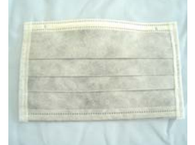
型號：YD-2050 品名：平面活性炭口罩 BFE 過濾效果 99.8% (測試粒徑 2.7 微米)