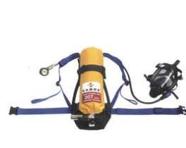
型號：SABRE SIGMA2 品名：空氣呼吸器 整套含面具、背板、鋼 瓶、攜行箱 (207Bar)