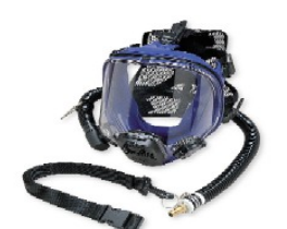
型號：ALLEGRO9901 品名：全面式送風面罩 整套含面罩、呼吸管、 腰帶、風量調節器