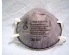
型號：3M-8247 品名：有機口罩 NIOSH-42CFR 84 防護等級：R95