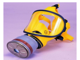
型號：YD-2056 品名：防毒面具 材質：矽膠 濾毒罐請來電洽詢