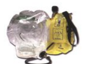
型號：NORTH 850 品名：緊急逃生呼吸器 整套含頭套、鋼瓶、攜 行袋 (400 公升) 使用 時間約 10 分鐘

※ 詳細規格，請來電洽詢。 環安技術顧問股份有限公司 TEL: 07- 6227860 FAX: 07- 6223439