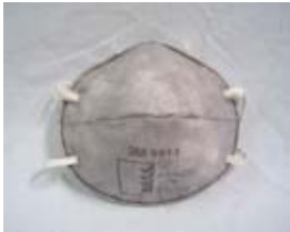
型號：3M-9913 品名：活性炭口罩 AN/NZS1716 防護等級：GP1