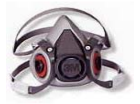
型號：3M-6200 品名：半面式防毒面具 面具材質：KRATON NIOSH-42CFR84