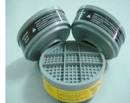
ST100100 有機濾毒罐 ST100200 酸性濾毒罐 ST100300 綜合濾毒罐