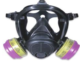
型號：YD-ST768 品名：全面式防毒面具 材質：合成矽膠 NIOSH-42CFR84