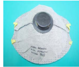
型號：FIDO-710CV 品名：帶閥活性炭口罩 NIOSH-42CFR 84 防護等級：N95