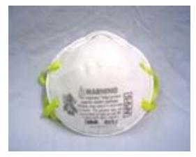
型號：3M-8210 品名：N95 防塵口罩 NIOSH-42CFR 84 防護等級：N95