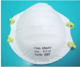
型號：FIDO-710 品名：N95 防塵口罩 NIOSH-42CFR 84 防護等級：N95