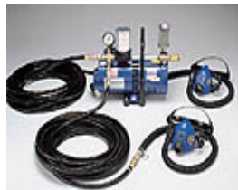
型號：ALLEGRO 品名：送風供氣系統 依現場需求不同可選 擇面具類型、送風管及 幫浦 (1-3 人使用)