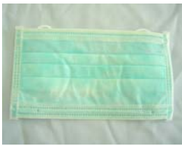
型號：YD-2051 品名：平面不織布口罩 PP 不織布、高密度濾菌 網、防潑水層