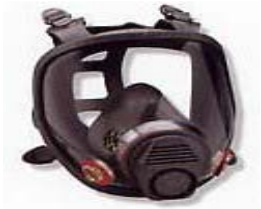
型號：3M-6800 品名：全面式防毒面具 面具材質：KRATON NIOSH-42CFR84