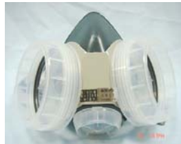
型號：GM-28 品名：雙罐式防毒面具 材質：NBR 認證：日本國檢 N128