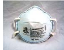
型號：3M-8246 品名：酸性口罩 NIOSH-42CFR 84 防護等級：R95