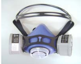
型號：YD-ST302 品名：半面式防毒面具 材質：合成矽膠 NIOSH-42CFR84