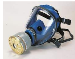
型號：YD-2055 品名：防毒面具 材質：合成橡膠 濾毒罐請來電洽詢