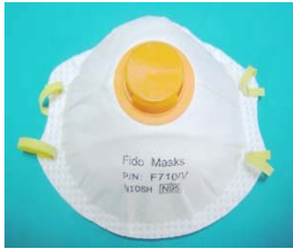
型號：FIDO-710V 品名：帶閥防塵口罩 NIOSH-42CFR 84 防護等級：N95