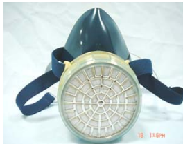
型號：GM-76 品名：單罐式防毒面具 材質：PVC 認證：日本國檢 N17