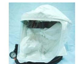
型號：NORTH-85301 品名：泰維克送風頭罩 整套含頭罩、呼吸管、 腰帶、風量調節器、消 音器