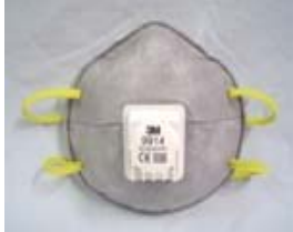
型號：3M-9914 品名：帶閥有機口罩 AN/NZS1716 防護等級：GP1