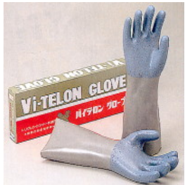
型號：FJ-1201 品名：耐強溶劑手套 材質： 抗甲苯,三氯乙烯 JIS 國檢 CNS 商檢合格