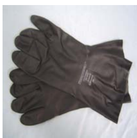
型號：ED-29500 品名：防酸鹼手套 材質：合成橡膠 長 33cm 厚 0.75mm CE 認證 CNS 商檢合格