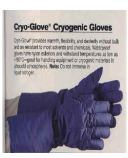
型號：TEMP-14L 品名：耐超低溫手套 可耐低溫 -160°C CE 認證