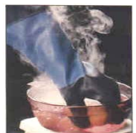
型號：TEMP-TEC332 品名：耐高溫酸鹼手套 耐高溫 300 度,防酸鹼 硫酸,氫氟酸,磷酸,氯氣 CE 認證 CNS 商檢合格