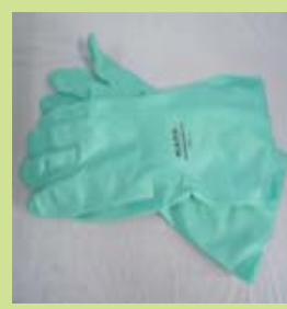
型號：MAPA-492 品名：防溶劑手套 材質：NITRILE 長 32cm 厚 0.38mm CE 認證 CNS 商檢合格