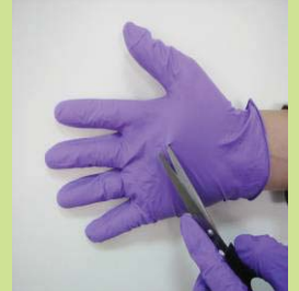
型號：YD-1028 品名：防酸鹼薄膜手套 材質：NITRILE 可防酸鹼溶劑,具抗穿 刺功能(無塵室可用)