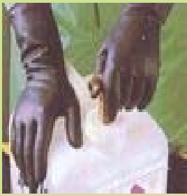
型號：MAPA-450 品名：防酸鹼手套 材質：NEOPRENE 長 41cm 厚 0.75mm CE 認證 CNS 商檢合格