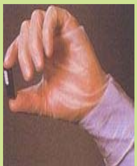
型號：YD-1027 品名：PVC 薄膜手套 材質：PVC