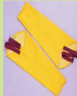
型號：YD-1033 品名：防酸鹼袖套 材質：PVC 厚 0.45mm 長 55cm