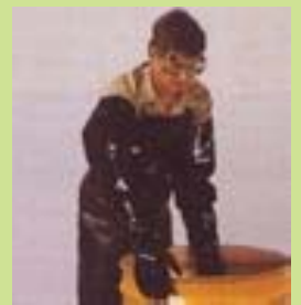
型號：ED-9430 品名：防酸鹼長手套 材質：NEOPRENE 長 79cm 棉內裡 CE 認證 CNS 商檢合格