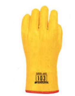
型號：DL-H103 品名：防寒手套 可耐低溫 -60 °C JIS 國檢