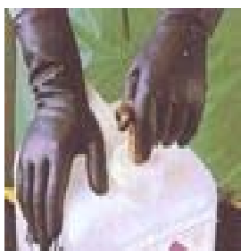
型號：MAPA-450 品名：防酸鹼手套 材質：NEOPRENE 長 41cm 厚 0.75mm CE 認證 CNS 商檢合格