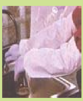
型號：TY-602 品名：Tyvek 袖套 材質：Tyvek