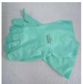
型號：ED-37176 品名：防溶劑手套 材質：NITRILE 長 33cm 厚 0.36mm CE 認證 CNS 商檢合格