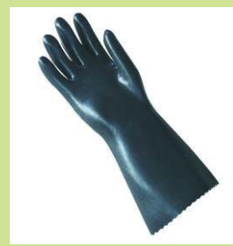
型號：MAPA-345 品名：PVA 化學手套 酮、酯、醚類可使用 長 37cm 厚 1.5mm CE 認證(無塵室可用)