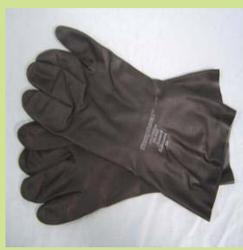
型號：ED-29500 品名：防酸鹼手套 材質：Neoprene 合成 長 30cm 厚 0.75mm CE 認證 CNS 商檢合格