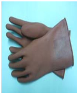
型號：YD-1029 品名：5KV 耐電手套 使用 1,000V 以內 JIS 國檢認證