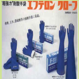
型號：FJ-A10 品名：耐強酸手套 材質：Hypalon 合成 王水,硝酸,甲醛,酪酸 JIS 國檢(無塵室可用)