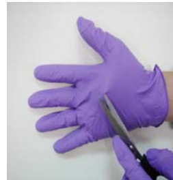
型號：YD-1028 品名：防酸鹼薄膜手套 材質：NITRILE 可防酸鹼溶劑,手部活動靈活具抗穿刺功能