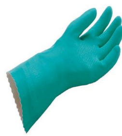
型號：MAPA-381 品名：防溶劑手套 材質：Nitrile+棉內裡 長 36cm 厚 0.45mm CE 認證 CNS 商檢合格