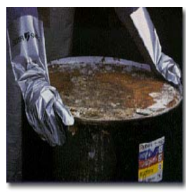
型號：4H-104 品名：銀色化學手套 可抗 200 種化學物品 CE 認證 CNS 商檢合格