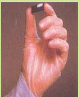
型號：YD-1026 品名：乳膠薄膜手套 材質：乳膠