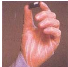
型號：YD-1026 品名：乳膠薄膜手套 材質：乳膠 型號：YD-1027 品名：PVC 薄膜手套