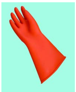
型號：YD-1029-20 品名：20KV 耐電手套 使用 17,000V 以內 BS EN60903、CNS 認證