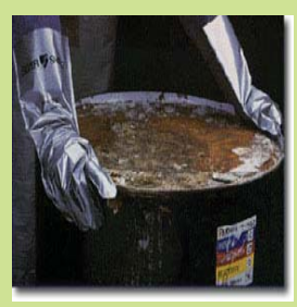
型號：4H-104 品名：銀色化學手套 可抗 280 種化學物品 長 40cm 厚 0.068mm CE 認證 CNS 商檢合格