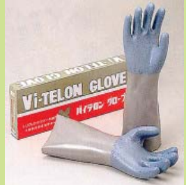
型號：FJ-1201 品名：耐強溶劑手套 抗甲苯,三氯乙烯強溶劑 JIS 國檢 (無塵室可用)