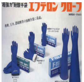
型號：FJ-A10 品名：耐強酸手套 材質：Hypalon 合成 王水,硝酸,甲醛,醋酸 JIS 國檢 CNS 商檢合格