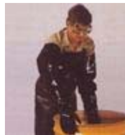
型號：ED-9430 品名：防酸鹼長手套 材質：NEOPRENE 長 79cm 棉內裡 CE 認證 CNS 商檢合格