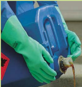
型號：MAPA-480 品名：防溶劑手套 材質：NITRILE 長 46cm 厚 0.55mm CE 認證 CNS 商檢合格