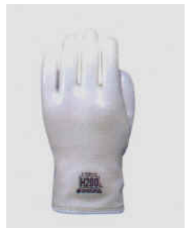
型號：DL-H200 品名：無塵耐熱手套 矽膠材質,耐熱 200 °C JIS 國檢