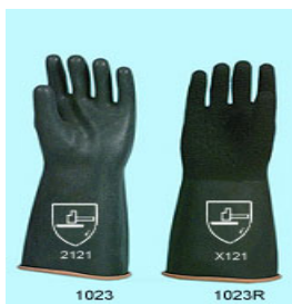
型號：YD-1023R 品名：防酸鹼手套 材質：Natural Latex 特厚,手掌壓紋處理 CE 認證 (台製品)