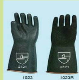
型號：YD-1023R 品名：防酸鹼手套 材質：Natural Latex 特厚,手掌壓紋處理 CE 認證