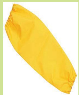
型號：YD-1033-10 品名：PVC 袖管 材質：PVC 厚 0.45mm 長 40cm

※ 詳細規格, 請來電洽詢。 環安技術顧問股份有限公司 台南: 05-5051150 高雄: 07-6227860