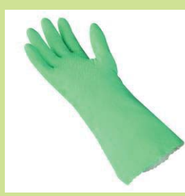
型號：MAPA-381 品名：防溶劑手套 材質：Nitrile+棉內裡 長 35.5cm 厚 0.85mm CE 認證 CNS 商檢合格