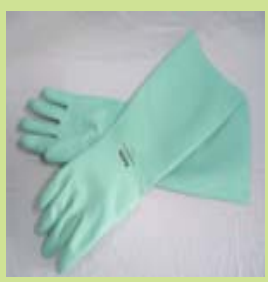
型號：MAPA-491 品名：防溶劑手套 材質：NITRILE 長 37cm 厚 0.45mm CE 認證 CNS 商檢合格