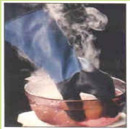
型號：TEMP-TEC332 品名：耐高溫酸鹼手套 耐高溫 300 度,防酸鹼 硫酸,氫氟酸,磷酸,氯氣 CE 認證 CNS 商檢合格