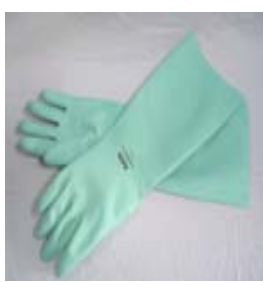
型號：MAPA-491 品名：防溶劑手套 材質：NITRILE 長 37cm 厚 0.45mm CE 認證 CNS 商檢合格