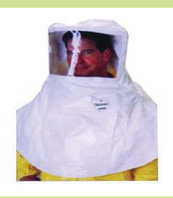
型號：TY-SL657B 品名：C 級防酸鹼頭罩 材質：Tychem SL 廠牌：DuPont