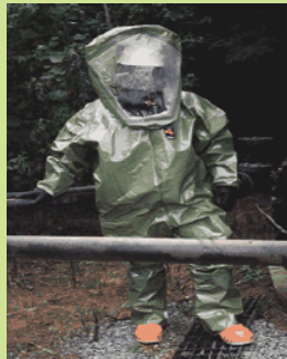
型號：TY-TK4T571 品名：B 級化學防護衣 材質：Tychem CPF4 (不含鞋) 廠牌：DuPont