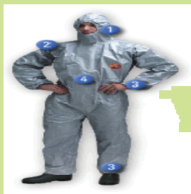
型號：TY-145T 品名：C 級化學防護衣 材質：Tychem F 廠牌：DuPont