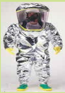
型號：TY-TK645 品名：A 級防火防護衣 材質：Tychem TK 耐溫 1093°C(6-8 秒) 廠牌：DuPont