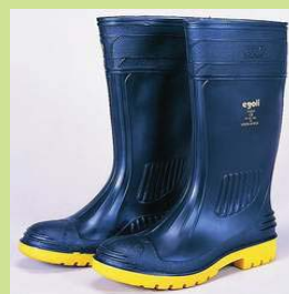
型號：TY-345 品名：防酸鹼安全靴 材質：PVC 有鋼頭鞋底鋼片 認證：EN345