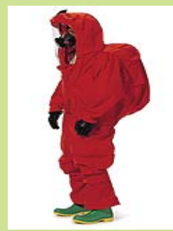
型號：TY-80110 品名：A 級訓練衣 材質：PVC 演習、訓練用防護衣 廠牌：DuPont