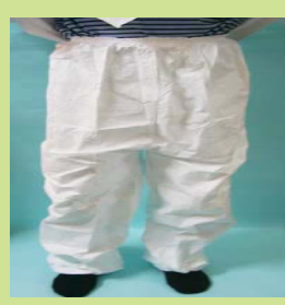
型號：TY-350S 品名：D 級泰維克褲子 材質：Tyvek 廠牌：DuPont