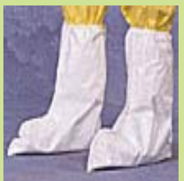
型號：TY-44903 品名：防酸鹼腳套 材質：TychemSL 廠牌：DuPont