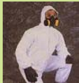
型號：TY-1422A 品名：D 級化學防護衣 材質：Tyvek (連身式) 廠牌：DuPont