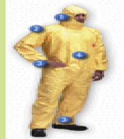
型號：TY-Max1 品名：C 級化學防護衣 材質：ChemMAX1 廠牌：Lakeland