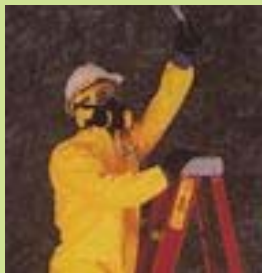
型號：TY-127T 品名：C 級化學防護衣 材質：Tychem C 廠牌：DuPont