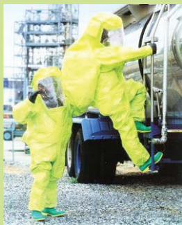
型號：TY-TK640 品名：A 級化學防護衣 材質：Tychem TK (不含鞋) 廠牌：DuPont