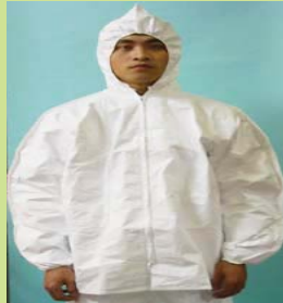
型號：TY-303S 品名：D 級泰維克上衣 材質：Tyvek 廠牌：DuPont