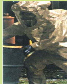
型號：TY-C3528T 品名：B 級防護衣 材質：Tychem CPF3 (不含鞋) 廠牌：DuPont