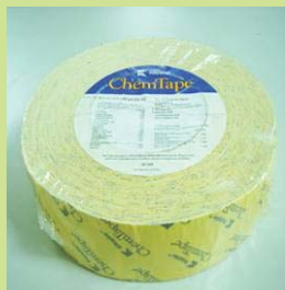
型號：YD-8018 品名：抗化學膠帶 尺寸：5 公分*54 公尺