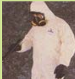
型號：TY-SL127 品名：C 級化學防護衣 材質：Tychem SL 廠牌：DuPont