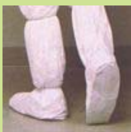
型號：TY-903 品名：Tyvek 腳套 材質：Tyvek 廠牌：DuPont