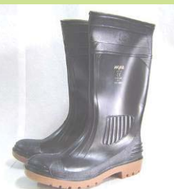
型號：TY-365 品名：防酸鹼安全靴 材質：合成橡膠 有鋼頭鞋底鋼片 認證：EN345

※ 詳細規格，請來電洽詢。 環安技術顧問股份有限公司 台南 06-5051150 高雄 07-6227860