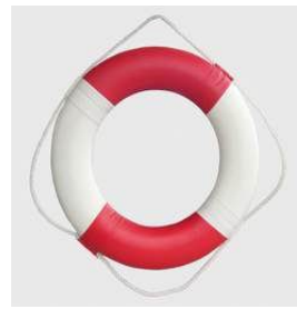
型號：YD-9020 品名：救生圈 浮力：100 公斤