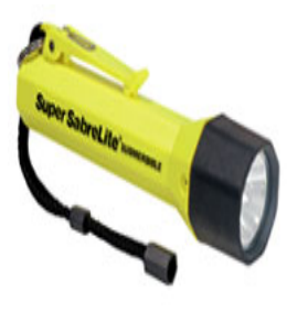
型號：PL-2000 品名：防爆手電筒 亮度：10,000 燭光 防水防爆，UL.CSA