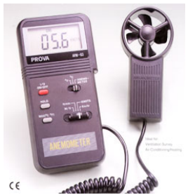
型號：AVM-03 品名：風速風溫計 範圍：風速 0.3-45 M/S 範圍：風溫 0-60°C