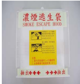
型號：YD-9002 品名：逃生袋置放盒 (可訂做)