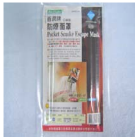
型號：YD-9003 品名：火場防煙面罩 耐 320°C，UL94.V-0