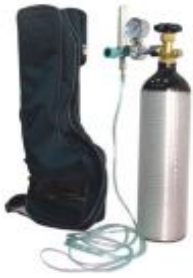
型號：YD-9001 品名：氧氣急救器 500 公升