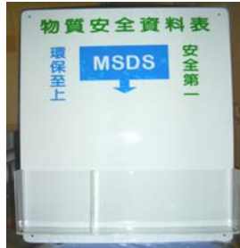
型號：YD-9019 品名：安全資料表架 (可訂做其他尺寸)