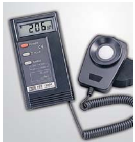
型號：TES-1332A 品名：照度計 範圍：200-200000Lux 解析度：0.1Lux