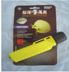
型號：UK-4AA 品名：防爆手電筒 亮度：12,000 燭光 防水防爆，UL.CSA