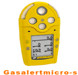
型號：YD-G9012 品名：五用氣體偵測器 偵測：氧氣一氧化碳、 硫化氫、可燃性氣體 可連續使用 12 小時 可用 AA 電池及充電電 池兩用 (擴散式)