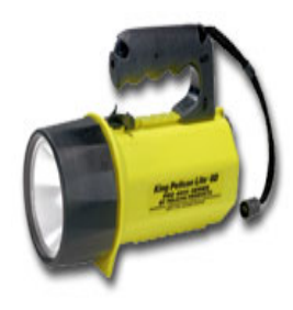
型號：PL-4000 品名：防爆手電筒 亮度：100,000 燭光 防水防爆，UL.CSA