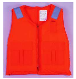
型號：YD-9021 品名：救生衣 浮力：100 公斤