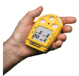
型號：YD-G9013 品名：四用氣體偵測器 偵測：氧氣一氧化碳、 硫化氫、可燃性氣體 可連續使用 12 小時