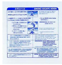
型號：YD-9005 品名：濃煙逃生袋 45*90cm，耐熱 135°C