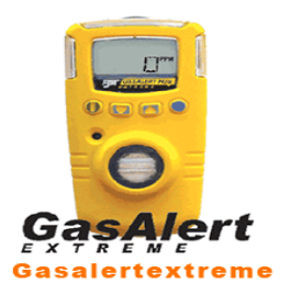
型號：YD-G9011 品名：可燃氣體偵測器 偵測：可燃性氣體 範圍：0-100%LEL