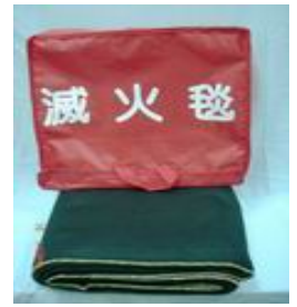
型號：YD-8016 品名：滅火毯 尺寸：3mm*1.5M*2M 100%氧化防火纖維