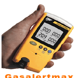
型號：YD-G9010 品名：四用氣體偵測器 偵測：氧氣一氧化碳、 硫化氫、可燃性氣體 可連續使用 12 小時 電動幫浦吸引型