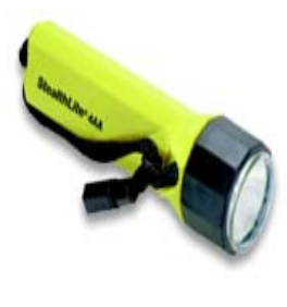
型號：PL-2400 品名：防爆手電筒 亮度：12,000 燭光 防水防爆，UL.CSA