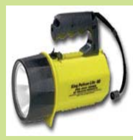
型號：PL-4000 品名：防爆手電筒 亮度：100,000 燭光 防水防爆，UL.CSA