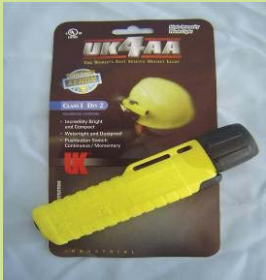
型號：UK-4AA 品名：防爆手電筒 亮度：12,000 燭光 防水防爆，UL.CSA