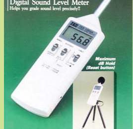
型號：TES-1350A 品名：噪音計 A、C 權衡網 範圍：35-130dB