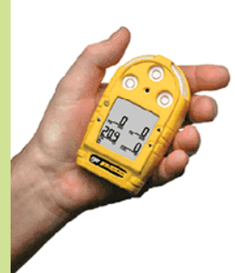
型號：YD-G9013 品名：四用氣體偵測器 偵測：氧氣一氧化碳、 硫化氫、可燃性氣體 可連續使用 12 小時