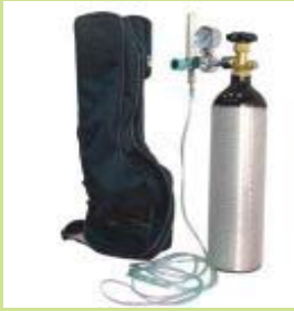
型號：YD-9001 品名：氧氣急救器 500 公升