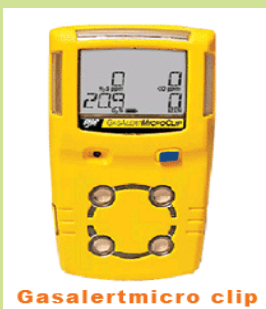
型號：YD-G9010 品名：四用氣體偵測器 偵測：氧氣一氧化碳、 硫化氫、可燃性氣體 可連續使用 12 小時 電動幫浦吸引型