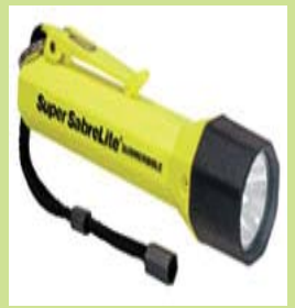
型號：PL-2000 品名：防爆手電筒 亮度：10,000 燭光 防水防爆，UL.CSA