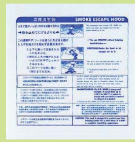
型號：YD-9005 品名：濃煙逃生袋 45*90cm，耐熱 135°C