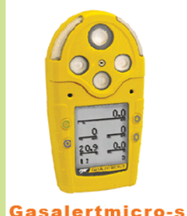
型號：YD-G9012 品名：五用氣體偵測器 偵測：氧氣一氧化碳、 硫化氫、可燃性氣體 可連續使用 12 小時 可用 AA 電池及充電電池 兩用(擴散式)