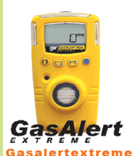
型號：YD-G9011 品名：可燃氣體偵測器 偵測：可燃性氣體 範圍：0-100%LEL