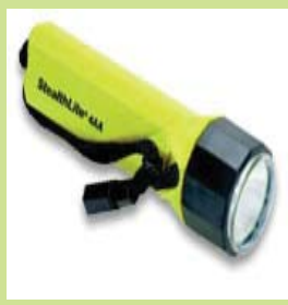
型號：PL-2400 品名：防爆手電筒 亮度：12,000 燭光 防水防爆，UL.CSA