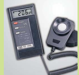
型號：TES-1332A 品名：照度計 範圍：200-200000Lux 解析度：0.1Lux