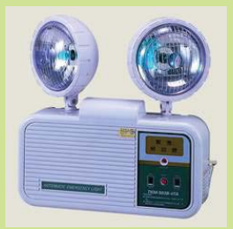
型號：YD-7083 品名：緊急照明燈 (CNS 商檢合格)