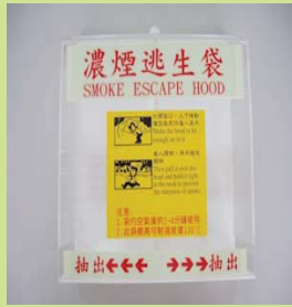
型號：YD-9002 品名：逃生袋裝置放盒 (可訂做)