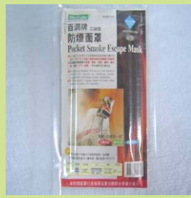
型號：YD-9003 品名：火場防煙面罩 耐 320°C，UL94.V-0