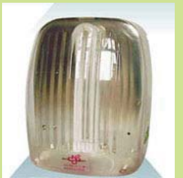
型號：YD-7082 品名：PL 照明燈 (CNS 商檢合格)