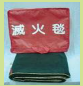
型號：YD-8016 品名：滅火毯 尺寸：3mm*1.5M*2M 100%氧化防火纖維